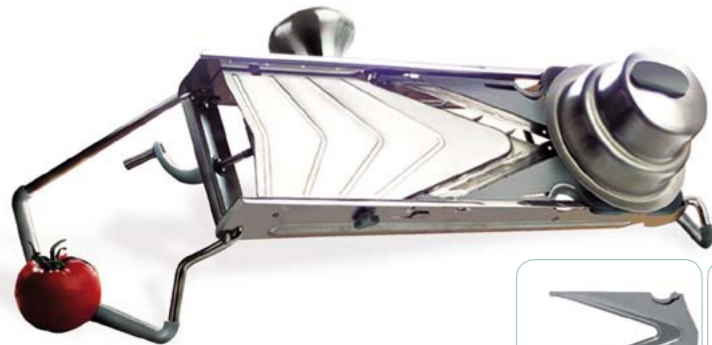
MANDOLINA PROFESIONAL "V"

› Acero inoxidable y policarbonato. Posición inclinada a 45° para una ergonomía y confort natural. Cuchillas en V para un corte más rápido y preciso. Pomo reversible para zurdos o diestros. Pulsador ergonómico para máxima seguridad. Manivela para regular el grosor de forma precisa y fácil. Modelos: Mandolina Profesional "V" 5 incluye (H) Lisa y Ondulada y (V) Juliana de 10, 7 y 4 mm. La versión "V" 7 incluye además la (H) Microdentada y la (V) Juliana 2 mm.