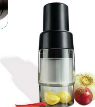
MINI PICADOR AJOS