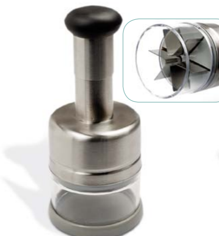
PICADOR AUTOMÁTICO "ELITE"

› Sencillo y rápido. Depósito transparente. Cuerpo en Acero Inox.