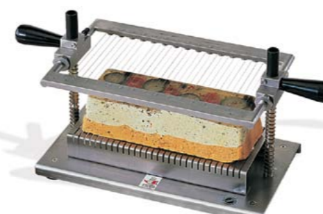
CORTADOR DE TARRINAS

› Acero Inoxidable 18/10. Tamaño máximo de tarrinas de 13 x 30 cm.