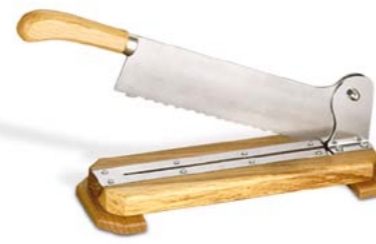
CORTADOR DE PAN