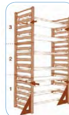
Incluye instrucciones de montaje