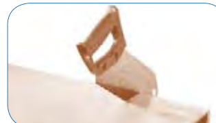
A medida. Recortable con un sierra de dientes finos.