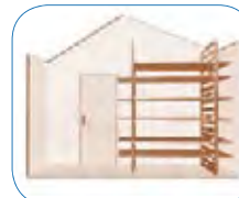
Fácil de modificar