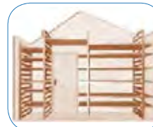
Fácil de completar y desmontar