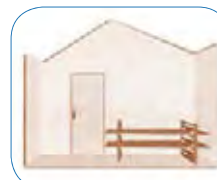
Fácil de montar