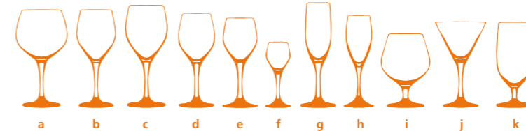
a b c d e f g h i j k