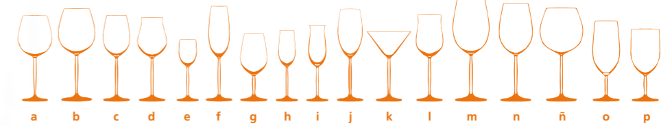
a b c d e f g h i j k l m n ñ o p