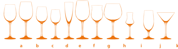
a b c d e f g h i j k