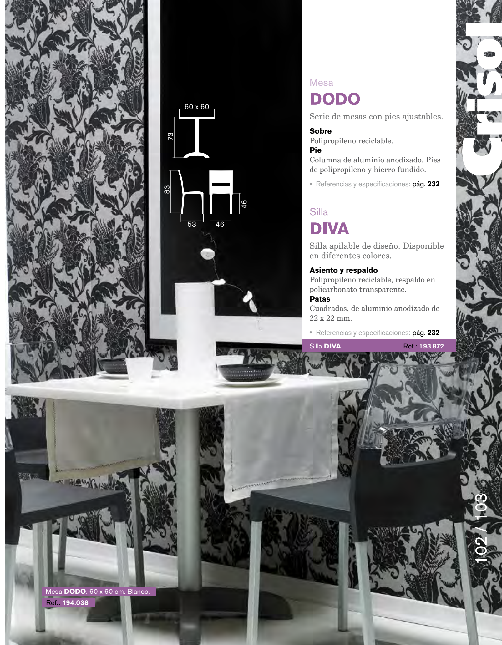
Mesa DODO . 60 x 60 cm. Blanco.