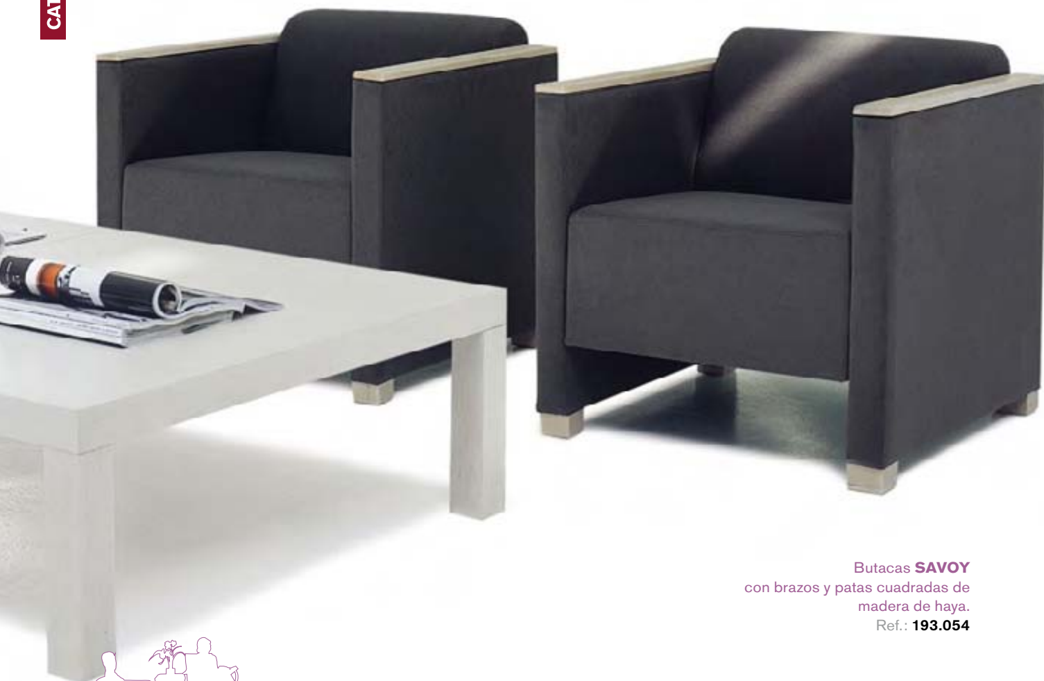
Butacas SAVOY con brazos y patas cuadradas de madera de haya. Ref.: 193.054