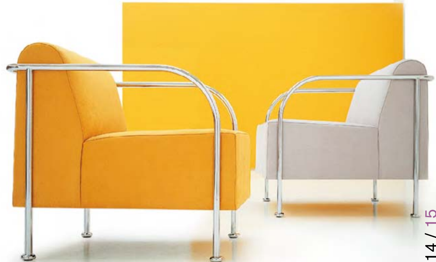
Butaca BRIDGE . Ref.: 129.969