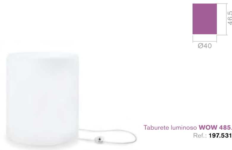
Taburete luminoso WOW 485 . Ref.: 197.531