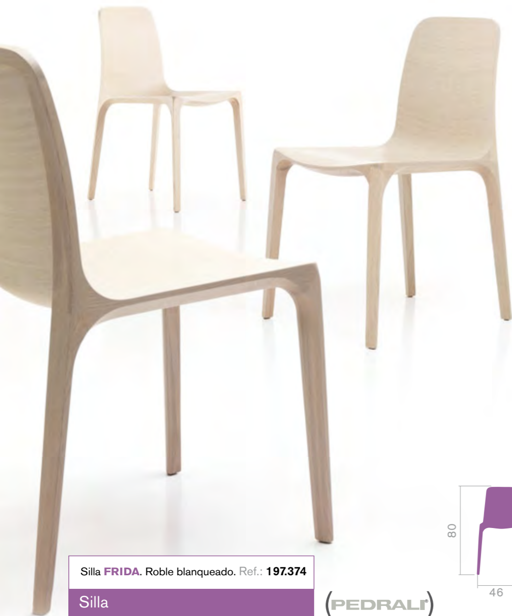
Silla FRIDA . Roble blanqueado. Ref.: 197.374