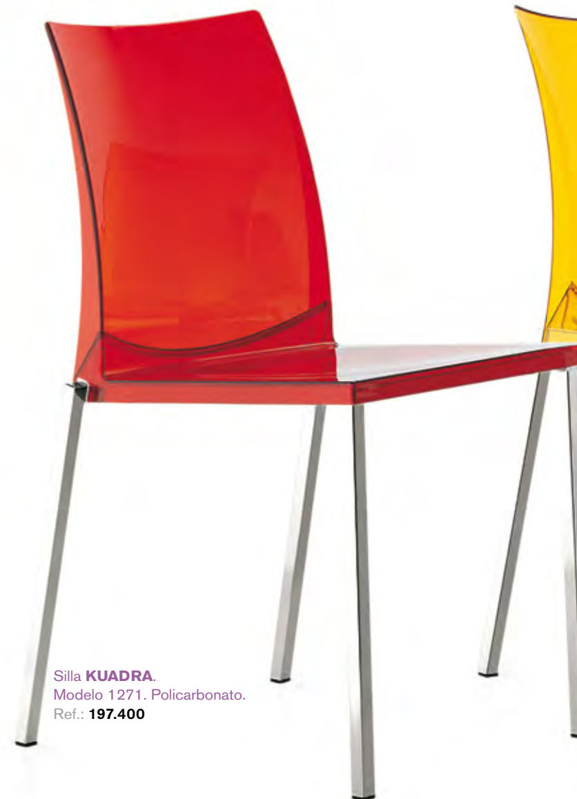
Silla KUADRA . Modelo 1271. Policarbonato. Ref.: 197.400