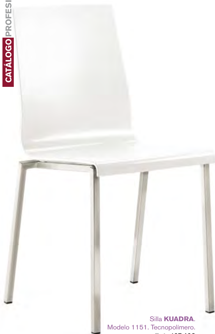
Silla KUADRA . Modelo 1151. Tecnopolímero. Ref.: 197.408