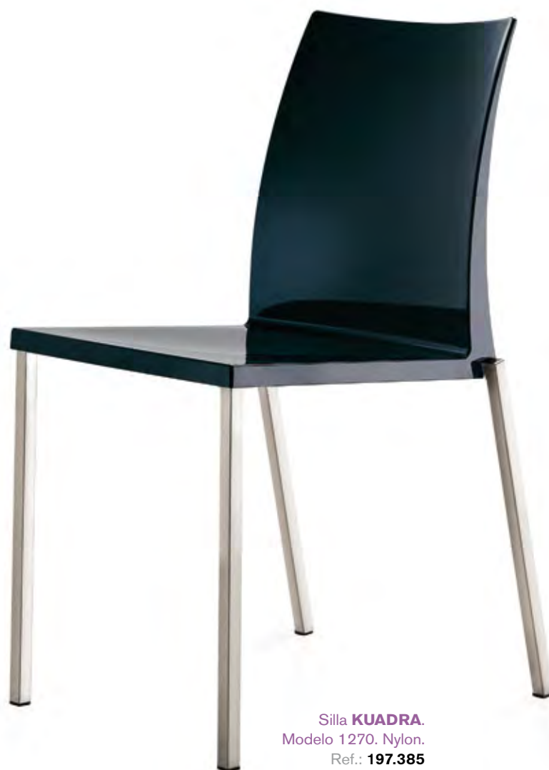
Silla KUADRA . Modelo 1270. Nylon. Ref.: 197.385