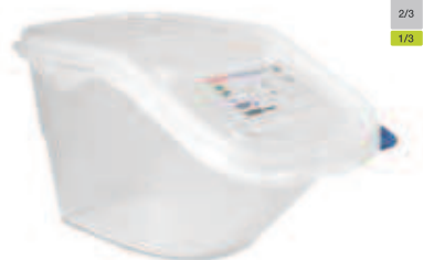
GN 2/3 - 415 x 340