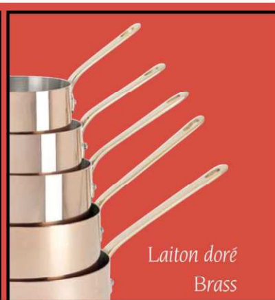
Laiton doré Brass