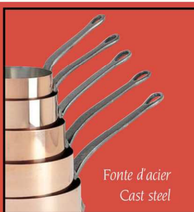
Fonte d'acier Cast steel